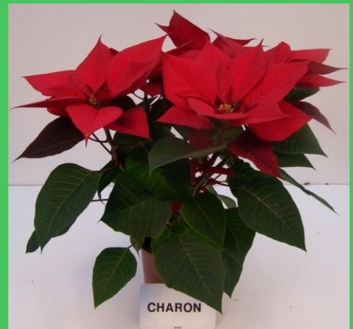
T molto bassa